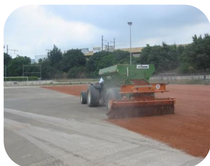
STADE CANET FLORIDE MARSEILLE