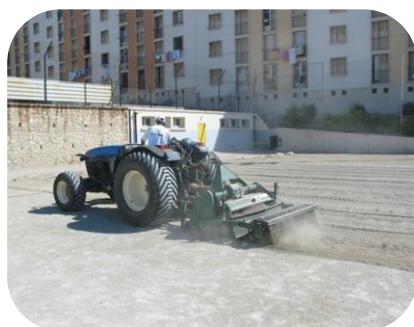
STADE BASTIDE CAZEAU MARSEILLE