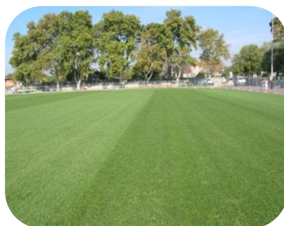
STADE JEAN BOUIN MARSEILLE