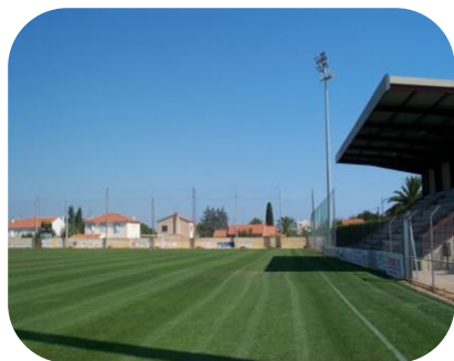
STADE PERRUC HYERES