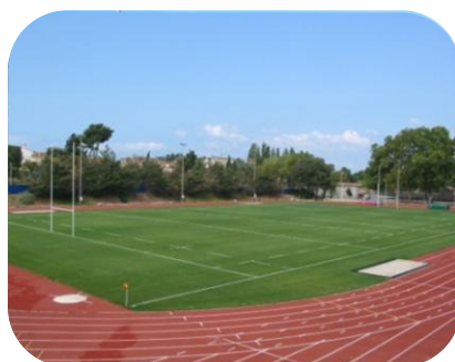
STADE JEAN BOUIN MARSEILLE