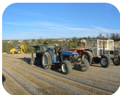
STADE RAOUL BRULAT DRAGUIGNAN