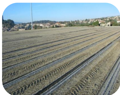
STADE RAOUL BRULAT DRAGUIGNAN