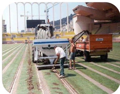
STADE LOUIS II MONACO