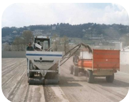
STADE BOLMONT MARIGNANE