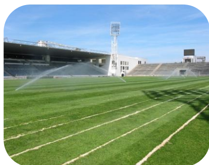
STADE DES COSTIERES NIMES