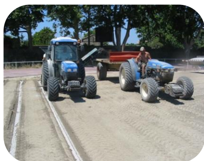
STADE JEAN BOUIN MARSEILLE