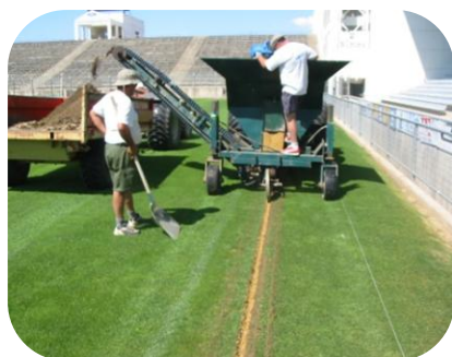
STADE DES COSTIERES NIMES