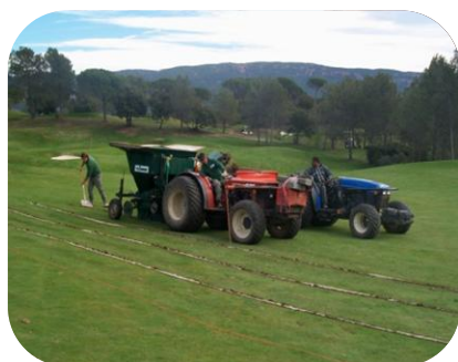
GOLF DE SAINT ANDREOL LA MOTTE