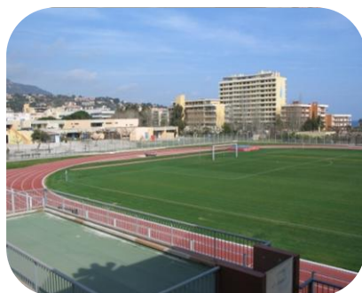
STADE MUNICIPAL LE LAVANDOU