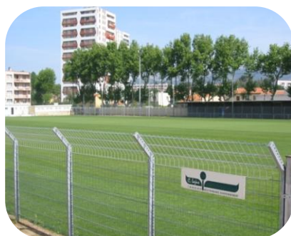
STADE MARQUET LA SEYNE SUR MER