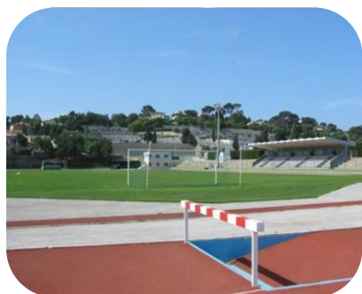
STADE SCAGLIA LA SEYNE SUR MER

www.mediterranee-environnement.fr Tél: 04 94 63 46 67