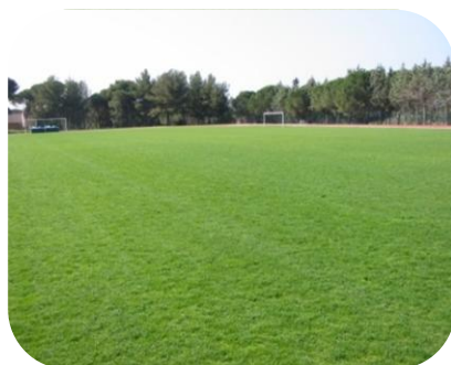
STADE COLONEL LECOQ FREJUS